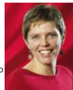
HILSEN EDLE DAASVAND partisekretær

Mens valgkampen pågår for fullt, og jeg er tilbake som partiaktivist, skal jeg starte opp igjen i et annet spennende og meningsfullt yrke; lærer for elever fylt av undring, livglede og kunnskapstørst. Med god organisering og tilrettelegging fra det lokale og det sentrale SV-laget blir det deilig å kombinere jobb, valgkampinnsats og å delta i viktige SV-aktiviteter etter valget også!